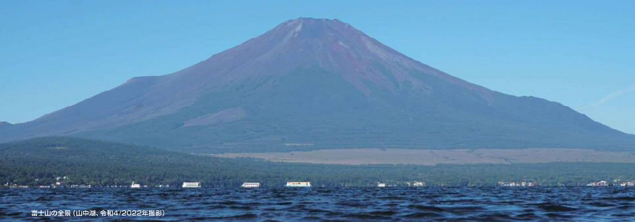
富士山の全景（山中湖、令和4/2022年撮影）