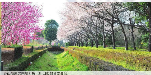
赤山陣屋の内堀と桜（川口市教育委員会）