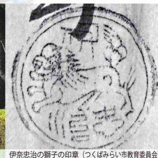
伊奈忠治の獅子の印章（つくばみらい市教育委員会）