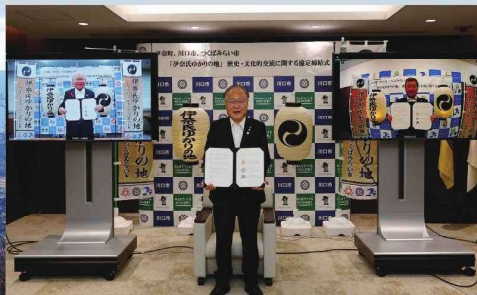
オンラインによる協定締結の様子（令和3年撮影 川口市役所本庁舎）