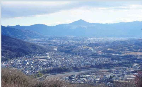
伊奈忠治の支配した秩父盆地（令和3年撮影 長瀬町登山）