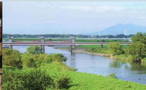
筑波山と小貝川の福岡堰（令和3年撮影 つくばみらい市福岡）