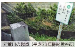
元荒川の起点（平成28年撮影 熊谷市）